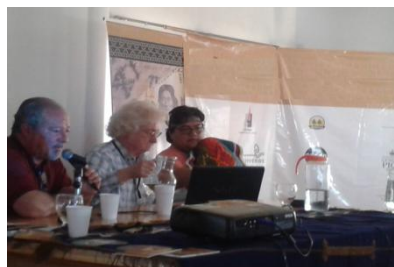
Provincia de La Pampa