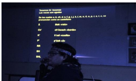
Provincia Buenos Aires

Realice ponencias públicas en distintos ámbitos, en las localidades de General Acha (La Pampa); San Carlos (Mendoza); Rincón de Los Sauces (Neuquén); Sierra Colorada-Paileman (Río Negro); Puerto Madryn, Puerto Pirámides, Gaiman y Gangan (Chubut); Centinela del Mar, Miramar, Olavarría, Trenque Lauquen, Chapadmalal, La Plata (Provincia de Buenos Aires) y Ciudad Autónoma de Buenos Aires (Capital Federal). Del mismo modo se fueron redactando materiales referentes al idioma para publicar futuramente todas las investigaciones sobre el mismo.