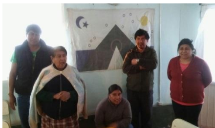
Gangan - Provincia del Chubut Pto. Madryn – Prov. Chubut