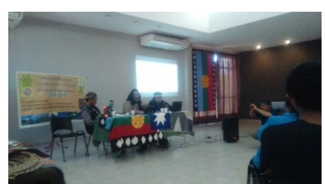
Provincia de Mendoza