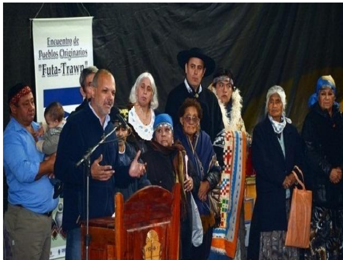
PARLAMENTO CORCOVADO PROVINCIA DEL CHUBUT