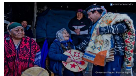
Provincia de Río Negro